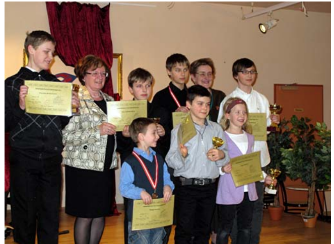
Die Preisträger der Kategorien 1A und 1B