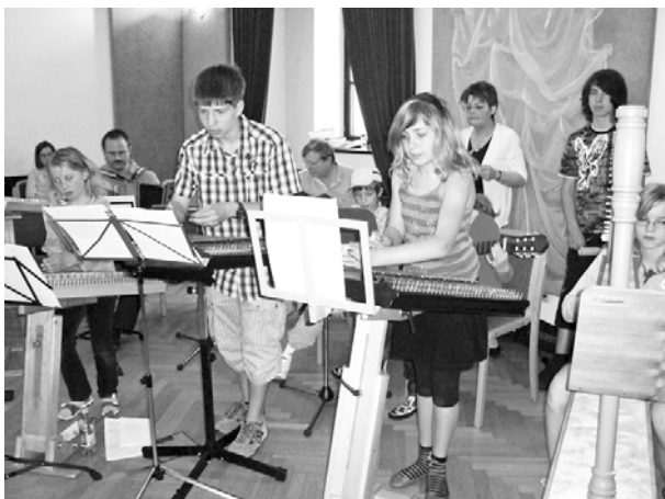
Musikwerkstatt für Kinder und Jugendliche