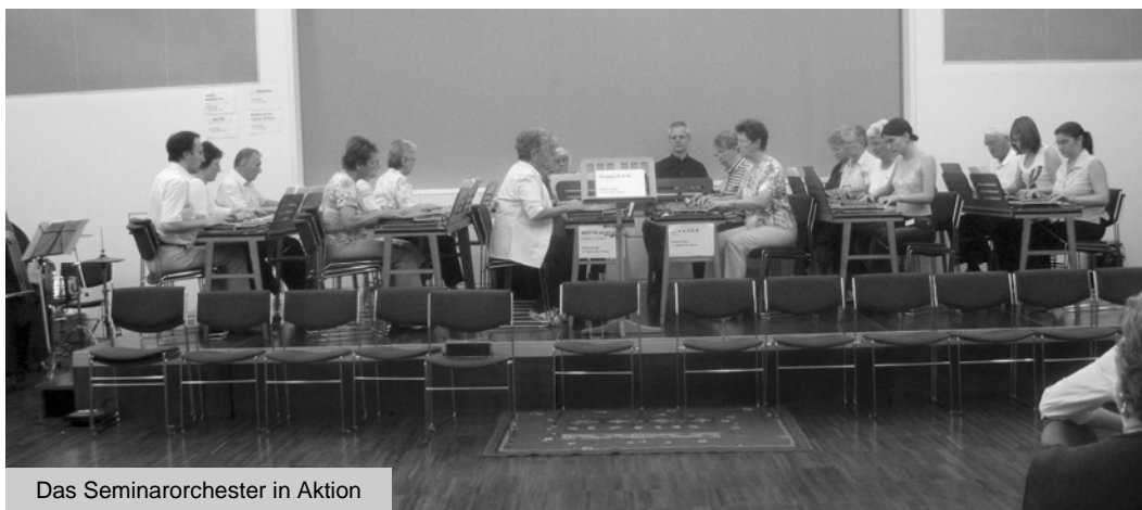
Das Seminarorchester in Aktion