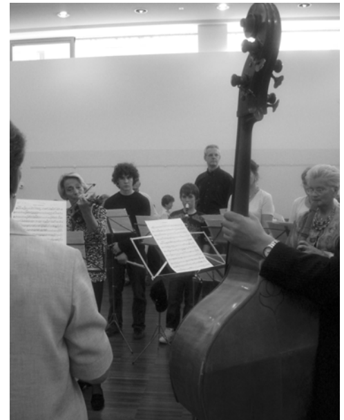
Impression von einem der Seminare

Der Veranstaltungsort: Das Bildungshaus Schloss Puchberg, ein Renaissance-schloss mit vierhundertjähriger Geschichte.