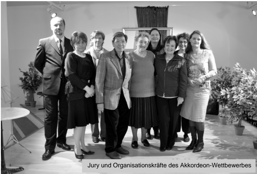
Jury und Organisationskräfte des Akkordeon-Wettbewerbes

P.b.b. Erscheinungsort: Wien Verlagspostamt: 1010 Wien GZ: 02 Z 030 122 M