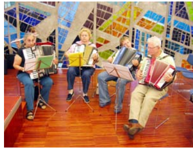
Jung und alt bei den Akkordeons

Thema: Das Zitherspiel verfeinern – Tipps und Tricks zu „swingendem“ Vortrag. Der Erfolg ist erstaunlich: Wie mit einfachen Mitteln ein neues Klangbild entstehen kann.