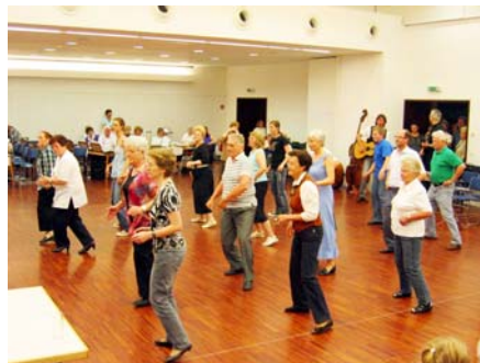
Line-Dance Einstudierung, ein richtiger Spaß

In den Stiegenhäusern und Gängen herrscht