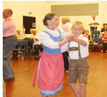
Auch beim Volkstanz: Jung und alt!

Nach dem Frühstück geht es dann zum individuellen Einzelunterricht für alle die sich dazu bei einer Lehrkraft gemeldet haben.