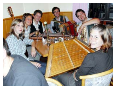
Fröhliche Runde im Stüberl