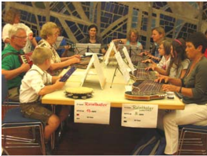
Zithergruppe für jung und alt

Am Abend dieses Tages steht das traditionelle Round-Table-Spiel auf dem Programm, bei dem Einzelspieler oder Gruppen ihre Lieblingsstücke vortragen können. Ein beliebter Programmpunkt im Seminarablauf, denn manche der Teilnehmer haben sonst kaum Gelegenheit vor Publikum ihr Können zu zeigen.