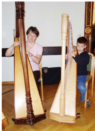
Harfen in Zeillern