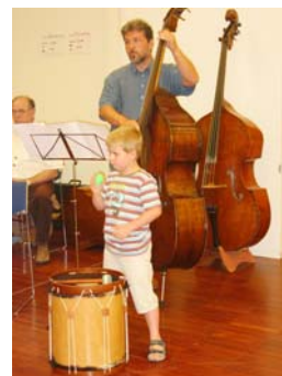
Kleiner Mann, groß in Form