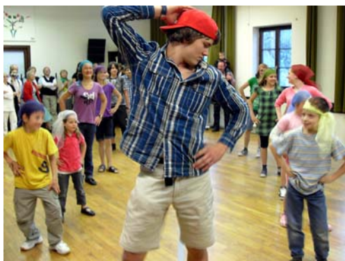
Kindertanz-Choreographie in Zeillern