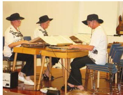
Die Verstärk't'n - Zithersound mit Verstärkern

Langsam wird es dann im Haus still, der Herr Verwalter macht seinen letzten Rundgang, quasi als stiller Hinweis für die Unermüdlichen, schlafen zu gehen.