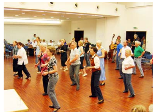
Line-Dance in Puchberg