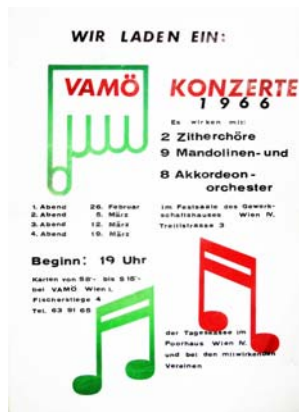
Ein altes Plakat aus dem VAMÖ-Archiv

Eröffnet wurde das Konzert durch den Zitherklub Krems (Leitung Erna Knobloch), der gefällige Zitherkompositionen zu Gehör brachte.