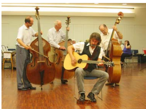
Kontrabässe in Puchberg

Die Vamö-Zitherseminare bieten neben der Aus- und Weiterbildung am Instrument Zither auch für andere Instrumente Unterricht und Fortbildung.