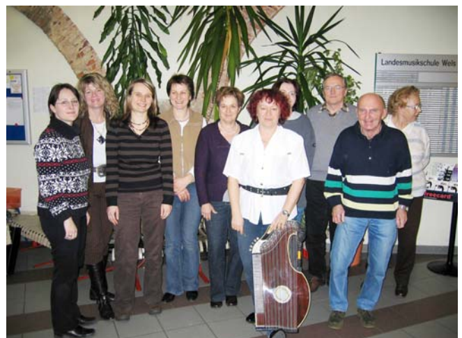
Die aktuellen Mitglieder der Zithervereins Harmonie 1891 Wels

Der Verein ist seit dem Jahr 1961 Mitglied im OÖ Volksbildungswerk.