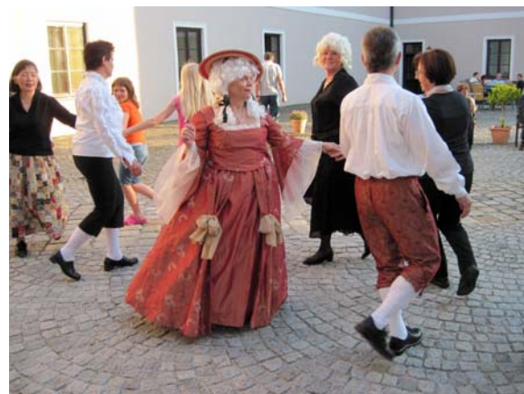
Tanzen mit Mozart

Der Mann muss die Hand der Dame zur Führung erbitten und sie dann wieder freundlich verlassen.